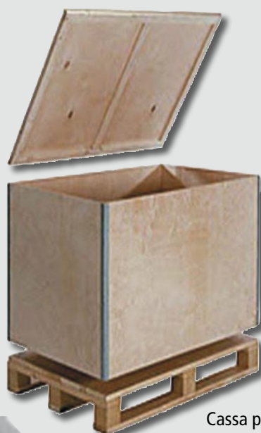
Cassa pieghevole rinforzata