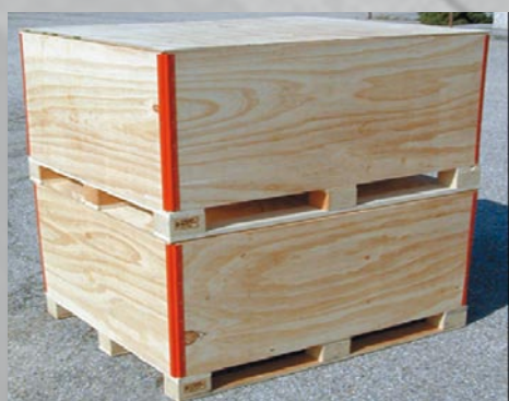
Cassa pieghevole in compensato di betulla