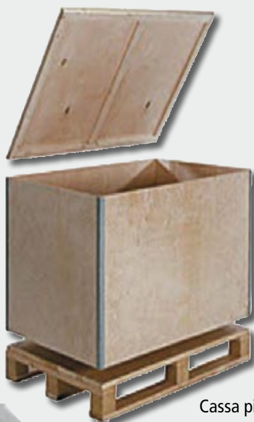
Cassa pieghevole rinforzata