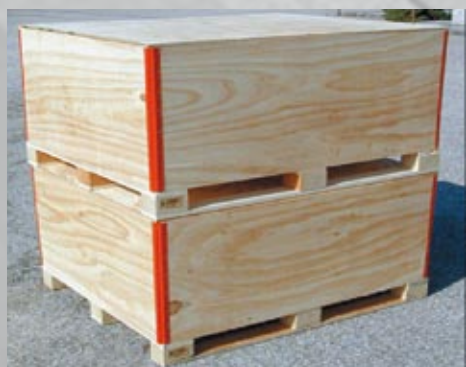
Cassa pieghevole in compensato di betulla