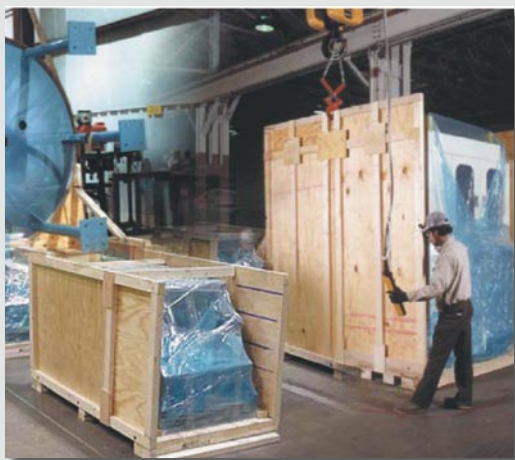
Operazioni di Imballaggio